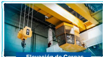
Elevación de Cargas