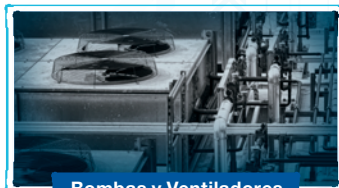
Bombas y Ventiladores

Con una estructura de menús amigable y una interfaz interactiva que mejora la experiencia del usuario, el CFW900 fue proyectado para facilitar el acceso a las informaciones y a las configuraciones, de modo simple y rápido. Es una solución inteligentemente proyectada para proporcionar ahorro de energía, elevados rangos de operación, seguridad, aumento de productividad y calidad en la red de procesos en que es implementada