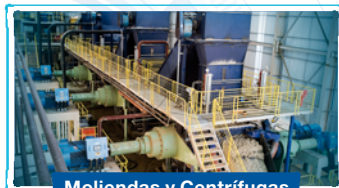
Moliendas y Centrífugas