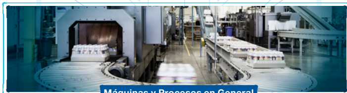
Máquinas y Procesos en General